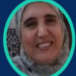
Pre MAARFIA N Université de Annaba

Les 25/26 Novembre 2024 AMPHI 15 (3000A)