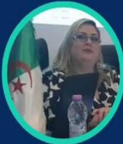
Pre Aci Ouardia Université de Blida 2