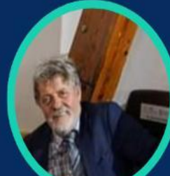
Pr KESKES S Université de Setif 2