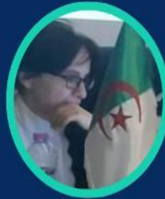
Pre BOUBAKOUR S Université de Batna 2