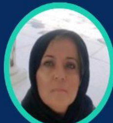
Pre AKMOUN H Université de Blida 2