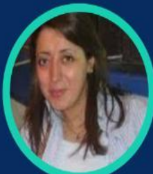
Pre HEDID S Université de Constantine I